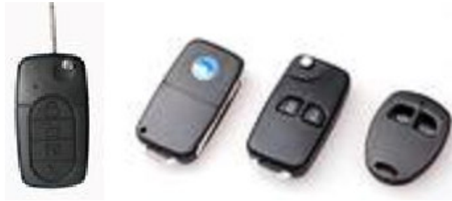
机车、汽车、无线遥控应用