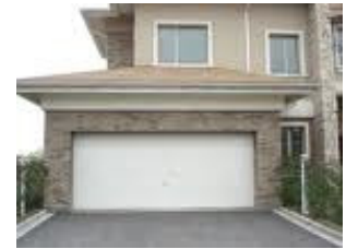
机车、汽车、无线 RF 接收器产品应用