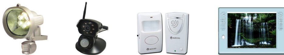
各种红外产品 (智能照明、安全防护、迎宾器、自动显示等产品)